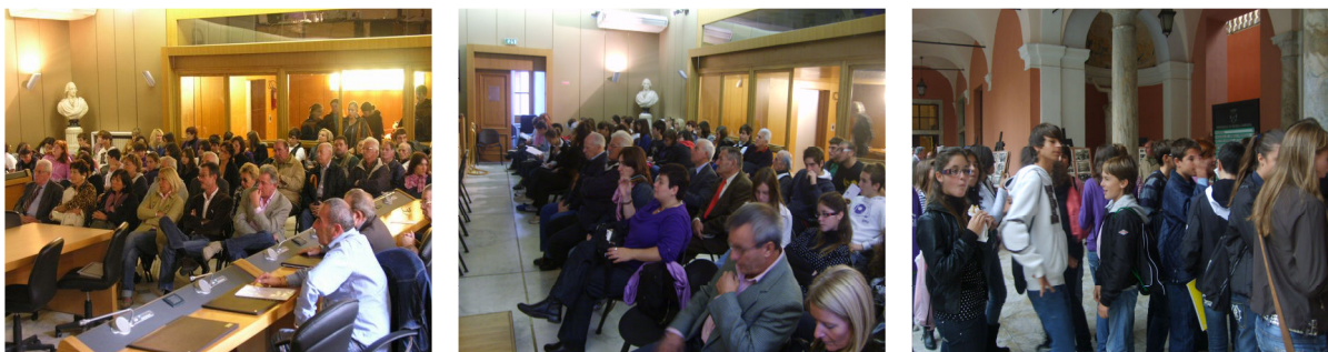
(alcuni momenti del convegno e della mostra)